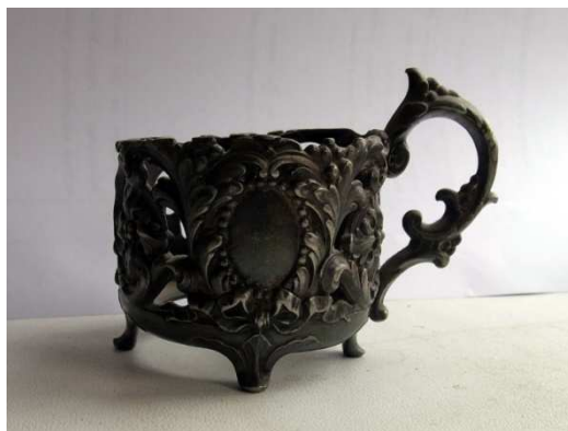
Подстаканник, изготовленный из сплава ВЕРИТ фирмой Н.Б.В. между 1909 and 1915. Частная коллекция Александра Марутяна, фото Давида Никогосяна.

включаются исключительно редко. С этим фактом согласуется проведенное нами сравнительное исследование количества изделий, выпущенных подразделением БРАТЬЯ БУХЪ с клеймами, использованными в 1882-1893 и 1893-1915 годах. При использовании фотографий клейм (от различных изделий), собранных одним из авторов (Д.Н.), в наличии оказалось 10 фотографий клейм из периода 1882-1893 годов длительностью в 11 лет и 13 фотографий клейм из периода 1893-1915 годов длительностью в 19 лет. Это дает нам среднее количество посеребренных изделий, производимых подразделением БРАТЬЯ БУХЪ: 0.9 и 0.7 продуктов в год (в произвольных единицах) для первого и второго периодов, соответственно, что свидетельствует об уменьшении количества продуктов, выпускаемых данным подразделением фирмы НОРБЛИНЪ, БРАТЬЯ БУХЪ и Т. ВЕРНЕРЪ. Этот факт никак не коррелирует с общим успехом компании Н.Б.В. на ювелирном рынке и с увеличением общего числа рабочих, занятых на производстве, примерно в три раза между 1882 и 1915 годами. Скорее всего, этот подсчет свидетельствует о включении части работников подразделения БРАТЬЯ БУХЪ (и соответствующего оборудования) в создание модной линии продуктов с использованием сплава ВЕРИТ.