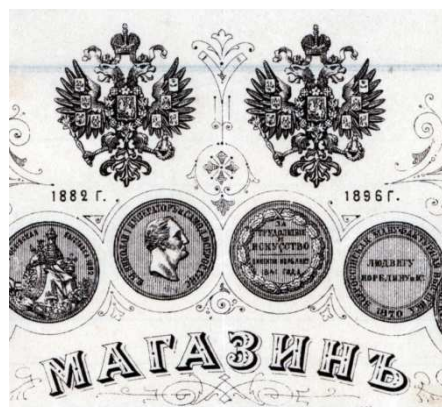
Верхняя часть счета, выданного в московском магазине фирмы Н.Б.В. 25 апреля 1914 года (наверху), и его фрагмент с парой двуглавых орлов (внизу).

В 1908 году фирма Н.Б.В. патентует новый оловосодержащий сплав “ВЕРИТ” (“VERIT”), используемый в качестве подложки для серебрения [8]. Применение подобного сплава позволяет производить подложки методом литья, что заметно снижает конечную стоимость посеребренных изделий. К тому же технологические преимущества этого нового сплава идеально совпадают с требованиями недавно появившимся художественным стилем модерн (по-польски Secesja, по-французски Art Nouveau, по-немецки Jugendstil).